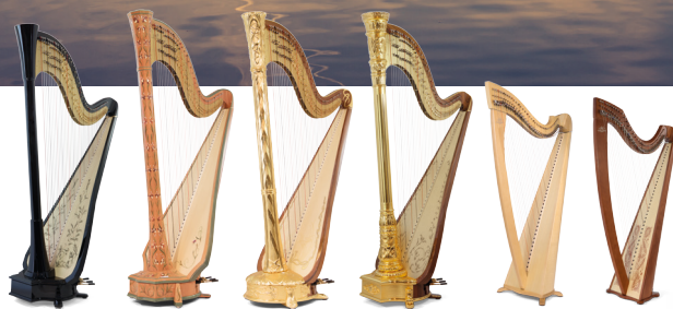
Atlantide Prestige Canopée Art Nouveau Oriane Excalibur Isolde

Wszystkie wydarzenia odbywają się w Szkole Muzycznej I i II st. im. B. Rutkowskiego w Krakowie ul. Józefińska 10 30-529 Kraków