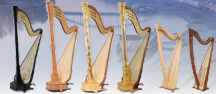
Atlantide Prestige Canopée Art Nouveau Oriane Excalibur Isolde