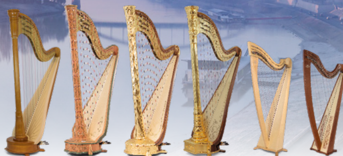
Égérie Canopée Art Nouveau Oriane Excalibur Isolde